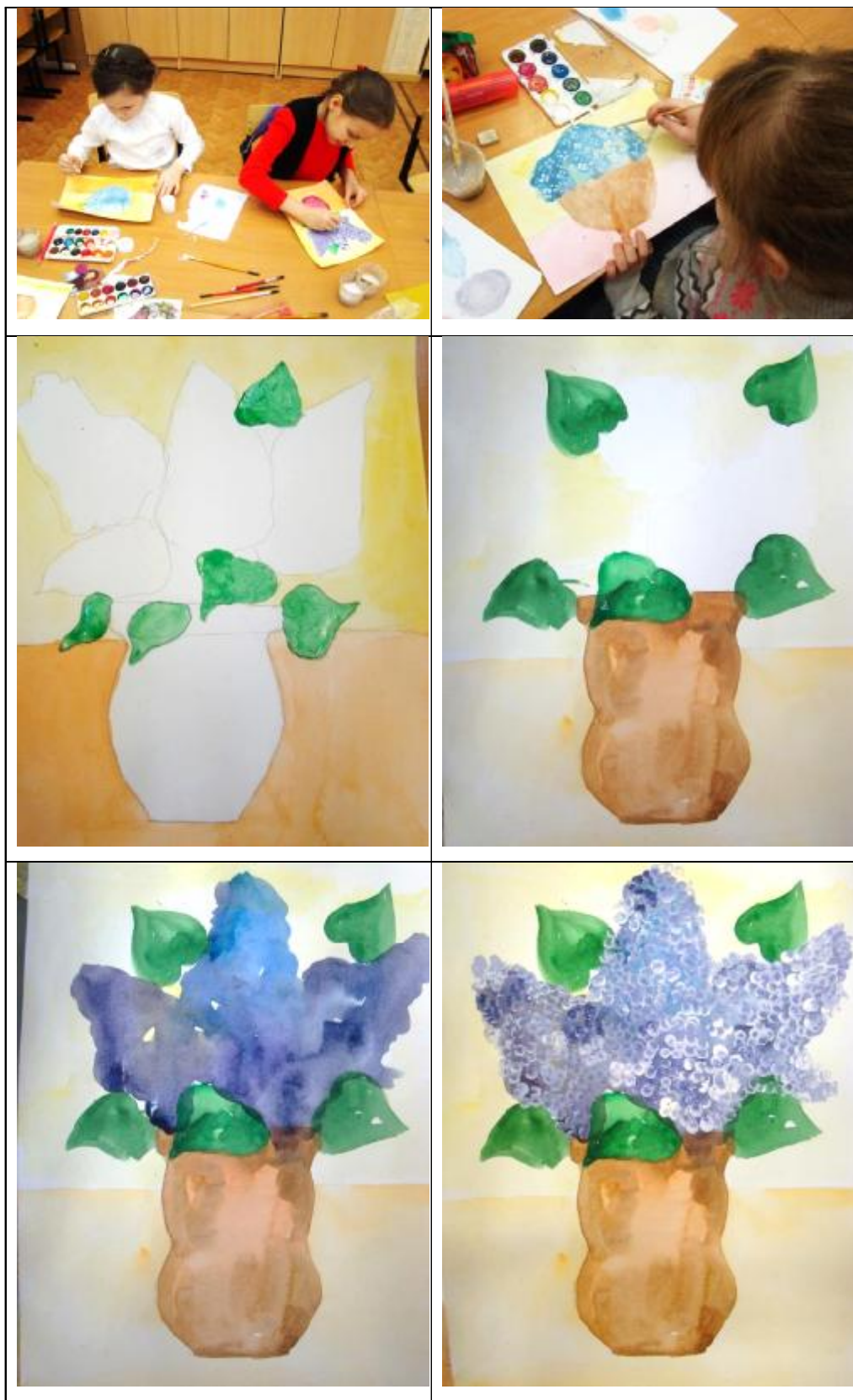
Рисунок в смешанной технике "Сирень и незабудки"