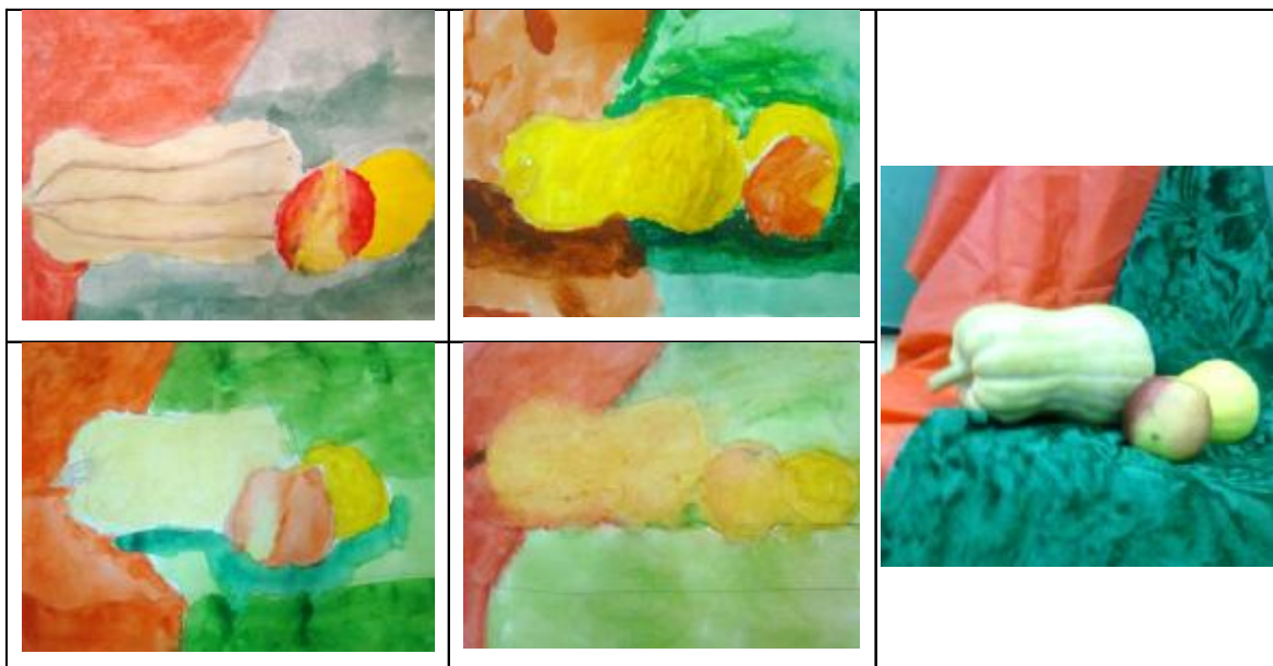
Рисунок с натуры "Натюрморт из нескольких предметов и цветных драпировок"