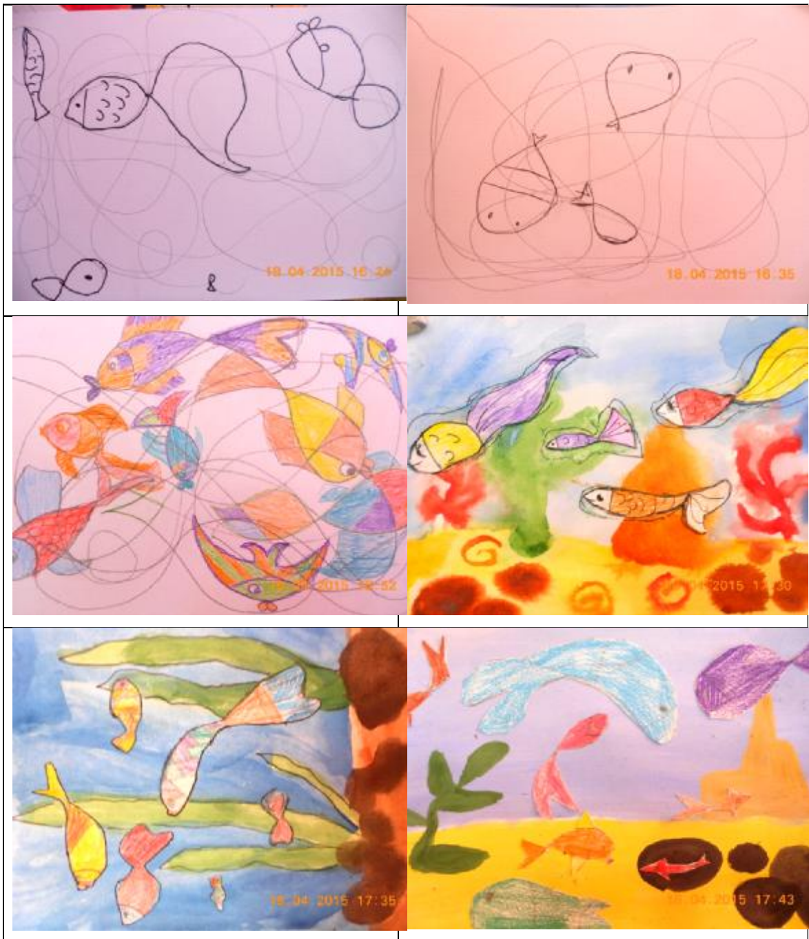
Рисунок в технике "Гриффонаж" "Морской мир"