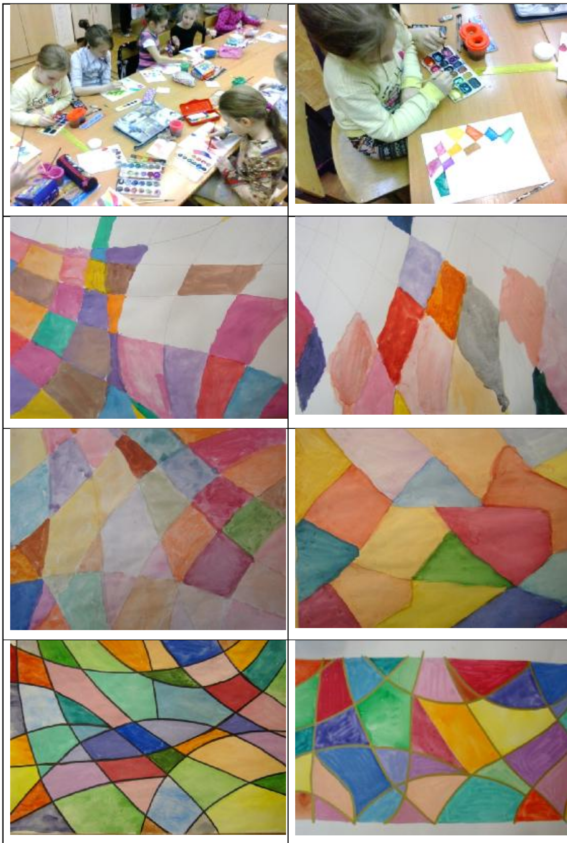
Рисунок-упражнение "Веселая мозаика"